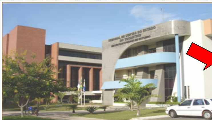
1 2 3 4 5 6 7 Sede do Instituto de Contas